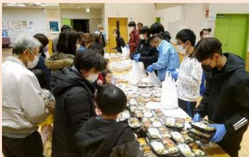
12月開催 ほたるこども食堂の様子

この寄付金は辰野ライオンズクラブと当会が共催し、毎月1回開催している「ほたるこども食堂」の運営に活用してほしいとのことで、10月に開催された「つくば祭」での募金活動や模擬店での売り上げ金の一部を今回の寄付金に充てていただいたそうです。