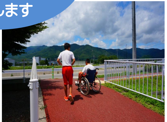
車イス体験等の福祉教育

「住み慣れた町でいつまでも暮らし続けたい」。そんな地域の皆様が願う暮らしを実現するために、辰野町社会福祉協議会は様々な事業を行っています。高齢者向けのサービスや介護保険事業のみならず、町民の皆様からいただいた社協会費や赤い羽根の共同募金の配分金を活用して、子ども達の福祉の芽を育むための福祉教育やボランティア活動の支援、障がい者の交流の場づくり、地区社会福祉協議会への支援等その事業は多岐に渡ります。次ページでは辰野町社会福祉協議会の事業を紹介いたします。