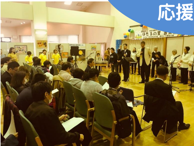
ほたるの里「音楽祭」