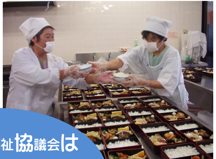
ふれあい型配食サービス 「ほのぼのランチ」