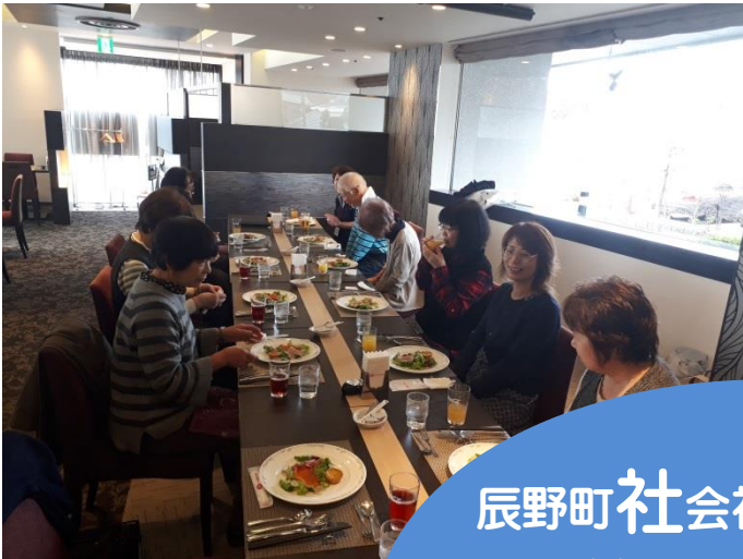
介護者リフレッシュ事業